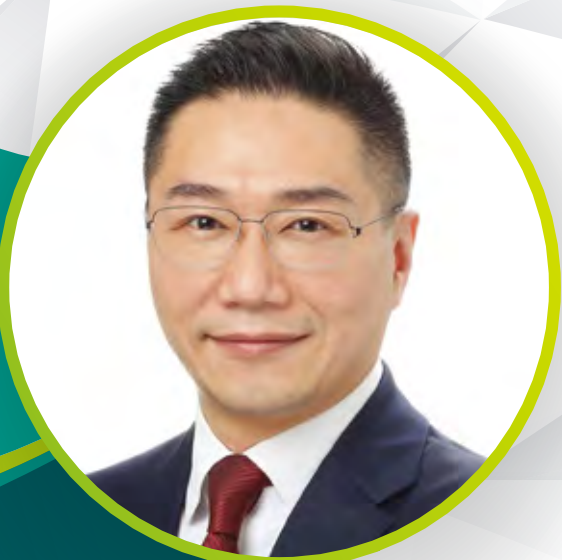
邵家輝，JP 立法會議員（批發及零售界）