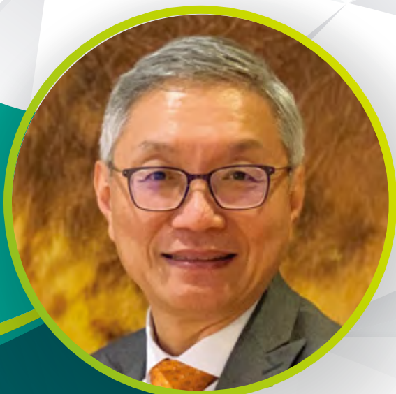
劉少懷醫生 香港醫務行政學院院長