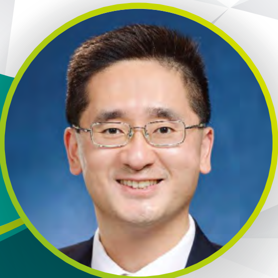
陳百里博士，JP 商務及經濟發展局副局長