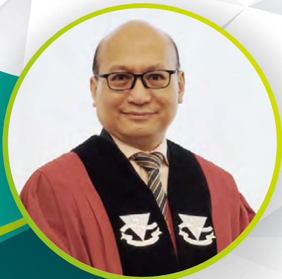
潘偉剛博士 香港中文大學醫學院意外及急救 醫學教研部客席教授助理