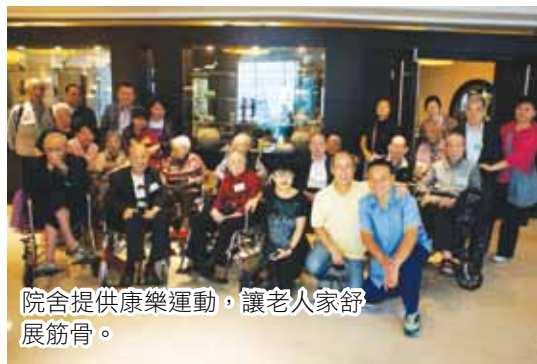
院舍提供康樂運動，讓老人家舒展筋骨。

甫踏進位於九龍塘的永健護老院，即被偌大而寬敞的環境吸引，共7,000多平方呎的院舍，令每名長者可享用的空間相當廣闊，而且永健人手比例更比其他護老院多一倍，遠超政府的要求。院舍主樓是一幢兩層高、被翠綠樹蔭環抱的別緻別墅，由於窗戶多，無論戶內戶外均通風舒適，加上專業及高質素的服務，令入住的長者擁有個人空間之餘，同時可享受群體生活，成為安享晚年的安樂窩。