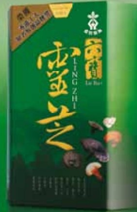
六寶靈芝 Lu Bao Ling Zhi