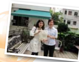
頤和園護老中心有限公司