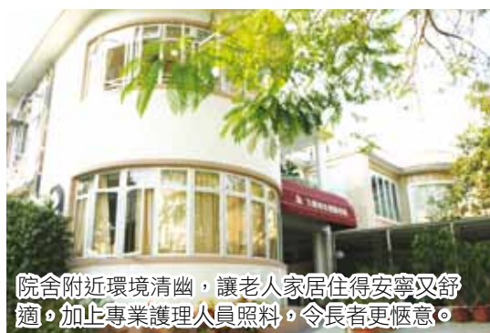
院舍附近環境清幽，讓老人家居住得安寧又舒適，加上專業護理人員照料，令長者更愜意。