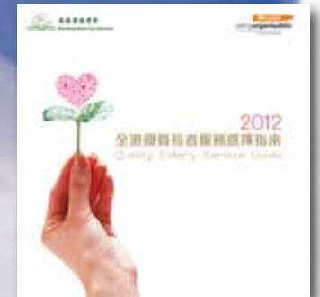
《全港優質長者服務選擇指南2012》 為加強全港市民對優質長者服務的認識，以及增加本地長者服務業界的透明度，我們每年都會推出優質長者服務選擇指南，為消費者提供一個涵蓋全港優質長者服務機構、團體及商戶的資訊平台。