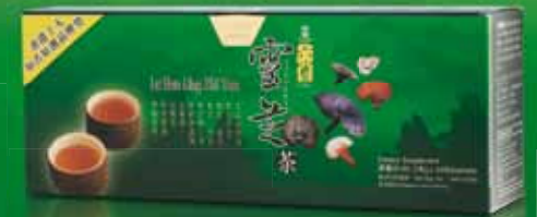
六寶靈芝茶 Lu Bao Ling Zhi Tea

六寶靈芝含有高成份靈芝多醣，經科學實驗證實，有效暢通血管，促進血液循環，同時有活化人體免疫系統，孤立及抗病變細胞作用，補肺平喘，益肝養心安神，亦有助調節膽固醇及脂肪，老少常服，延年益壽，青春常駐。