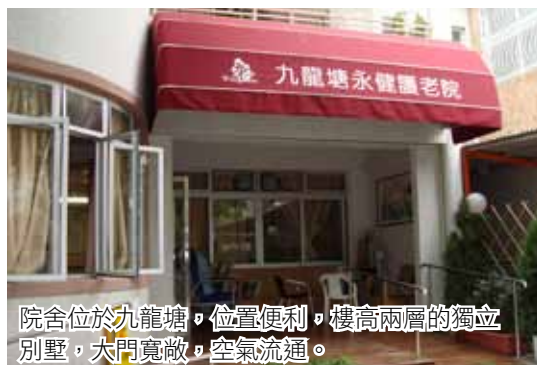
院舍位於九龍塘，位置便利，樓高兩層的獨立別墅，大門寬敞，空氣流通。