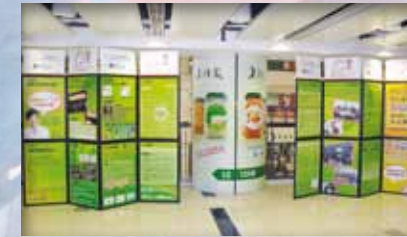
「優質長者服務計劃」展覽 獲多個商場及時昌迷你倉的鼎力支持，「優質長者服務計劃」展覽於全港各區巡迴展出。首站為九龍城廣場，2011年12月27日亦已在屯門市廣場展出。