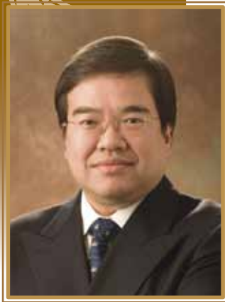
胡定旭GBS太平紳士 醫院管理局主席