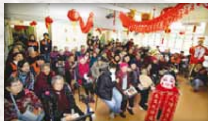
香港醫護學會－「新春送暖大行動」 新春佳節，香港醫護學會成員與一眾熱心的義工連同車隊，於各大院舍及醫院派發生果予長者。

轉瞬間，「優質長者服務計劃」已經踏入第三年了。去年，我們一如以往秉承我們的目標，致力為長者服務，為安老業界提供了一系列的活動，包括有迪士尼同樂日、院舍探訪、中秋送暖大行動等。希望我們的用心令長者感到窩心、放心、安心。