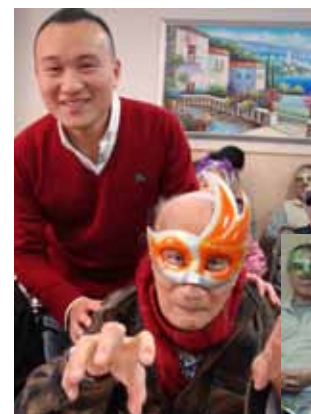
院舍不時舉辦活動，為公公婆婆帶來節日氣氛。