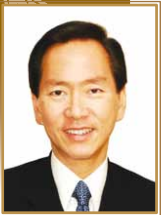
陳智思先生 全國人民代表大會香港代表