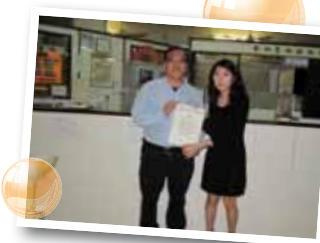
瑞康護老中心(象山邨分院)