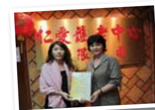
仁愛護老中心有限公司