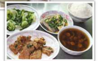
每餐三飯一湯。專設糖尿、痛風、耆英保健藥膳餐。