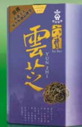
六寶雲芝 Lu Bao Yun Zhi