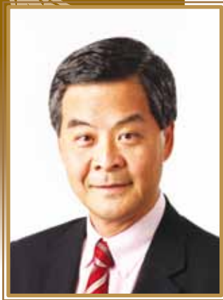
梁振英先生 全國政協常委