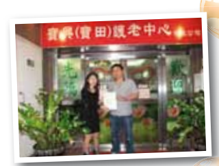
寶興(寶田)護老中心有限公司