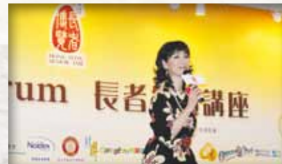
「星光薈萃耆樂無窮－優質長者服務巡禮」 「星光薈萃耆樂無窮－優質長者服務巡禮」，邀請到愛心大使陳植森博士及影視紅星區靄玲小姐為表演嘉賓。