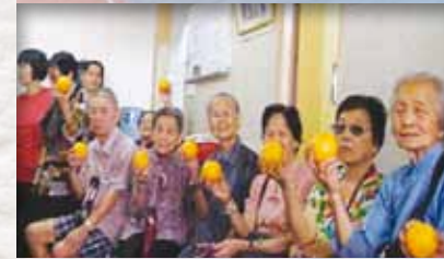
群星支持－香港醫護學會「中秋愛心送暖大行動」 今年中秋，香港醫護學會會員聯同一班義工及車隊，於中秋佳節在各大院舍、醫院送贈水果予長者。