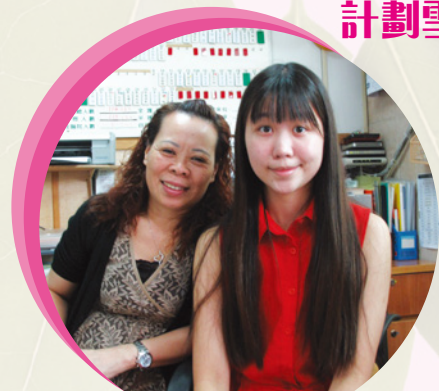
● 香港醫護學會幹事與副院長合照