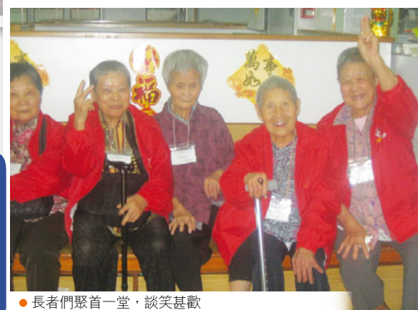
● 長者們聚首一堂，談笑甚歡