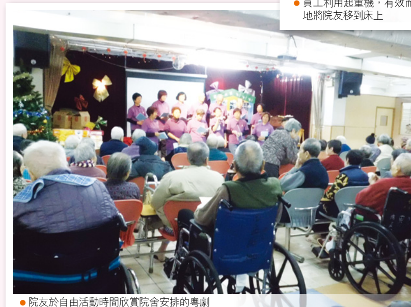
● 院友於自由活動時間欣賞院舍安排的粵劇