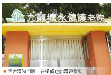
● 院舍清晰門牌，在遠處也能清楚看到