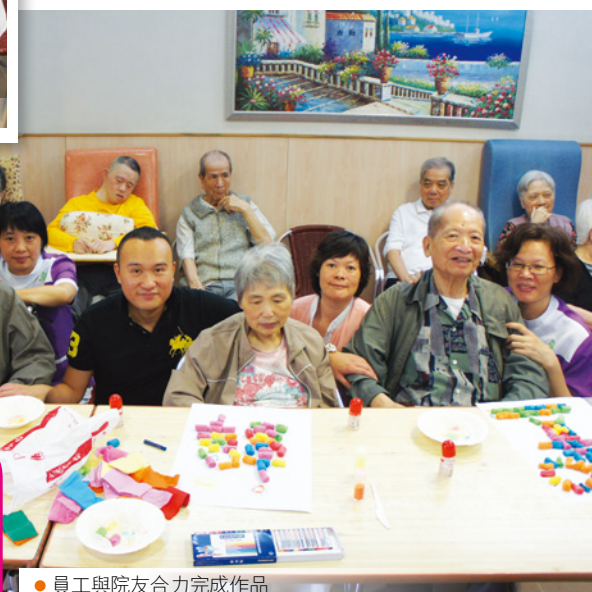
● 員工與院友合力完成作品