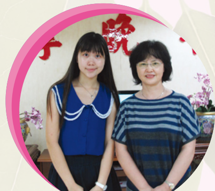
● 香港醫護學會幹事與院長合照