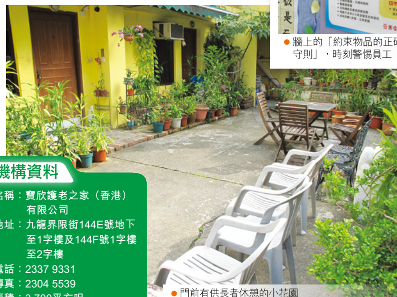
● 門前有供長者休憩的小花園