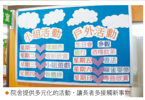
● 院舍提供多元化的活動，讓長者多接觸新事物