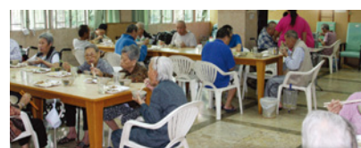
● 院舍地方寬敞，提供充足休憩空間