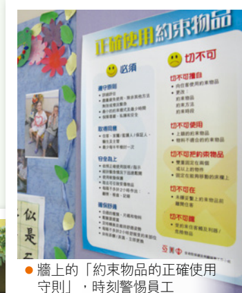
● 牆上的「約束物品的正確使用守則」，時刻警惕員工

寶欣護老之家之所以可成為現今獨當一面的安老院舍，不但因為呂院長和員工一直努力，亦因為參與香港醫護學會的「優質長者服務計劃」認證，得到政府資助的機會亦比其他院舍為多，才可滿足長者生理及心理各方面的需要。最後，呂院長亦承諾會一直參與「優質長者服務計劃」並鼓勵同行參與，提醒自己及員工時刻更新現時社會對安老服務的要求，一方面保持著院舍優勢，亦同時為本港安老服務而努力，更進一步。