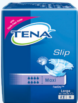
添寧棉柔成人紙尿褲 夜用型

添寧夜用型，強力吸濕設計，比一般日用紙尿褲吸尿多50%。只需一片，可以防漏一整晚，你和家人都無需再半夜起床更換紙尿褲，安心甜睡一整夜。