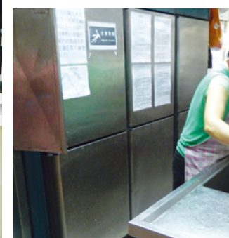
● 雪櫃上有清晰的食物分類指引，確保院友的食物安全