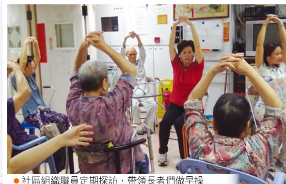
● 社區組織職員定期探訪，帶領長者們做早操

院舍，從而為家中長者選擇更安心及可信賴的服務。香港醫護學會期望透過「優質計劃」，與各大安老院舍攜手提升本港安老護理的質素，讓長者們得以安享晚年。