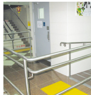
● 地下提供斜台及升降機讓行動不便的長者上落

已連續兩年獲得香港醫護學會頒發的「優質長者服務計劃」認證的鈞溢 (山景) 安老院得到認證後並沒有鬆懈，反而時刻警惕員工保持良好的服務質素及醫護技巧。院舍定期邀請註冊護士或醫護部門到訪，為員工進行培訓，培訓內容包括教導員工與長者的溝通技巧、扶抱技巧及如何防止長者走失等。院舍亦定期為員工進行評核，以確保員工的質素達到計劃訂立的水平。總括而言，優質計劃為鈞溢 (山景) 安老院從社交支援到員工培訓方面提供指引和監察的功能，讓鈞溢 (山景) 安老院在安老行業保持優勢。