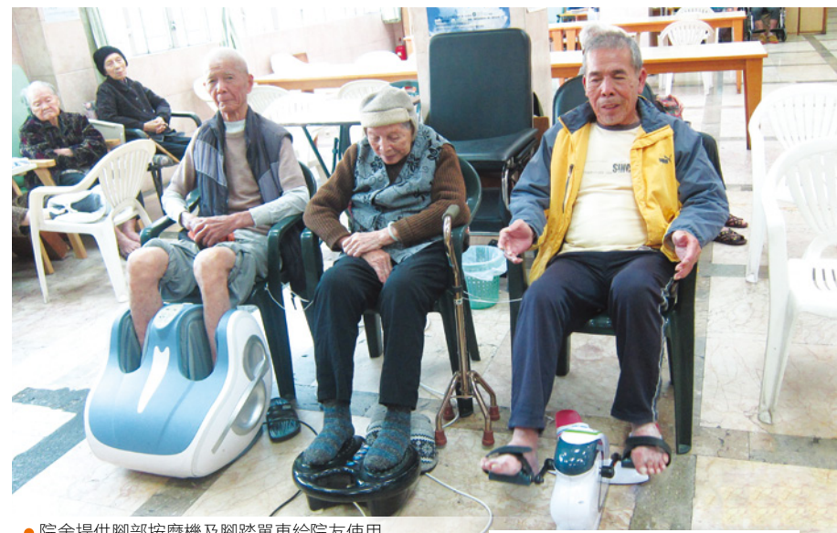
● 院舍提供腳部按摩機及腳踏單車給院友使用

從。香港醫護學會的「優質計劃」以簡單及清晰的評審制度，替院舍作出全面檢查。「優質計劃」希望透過統一及明確的標準，讓各院舍能減卻行政上的混亂情況，最終達到合格的水平，為長者提供優質服務。