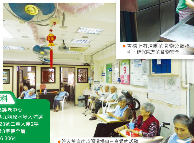
● 院友於自由時間選擇自己喜愛的活動