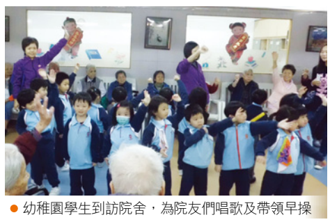
● 幼稚園學生到訪院舍，為院友們唱歌及帶領早操