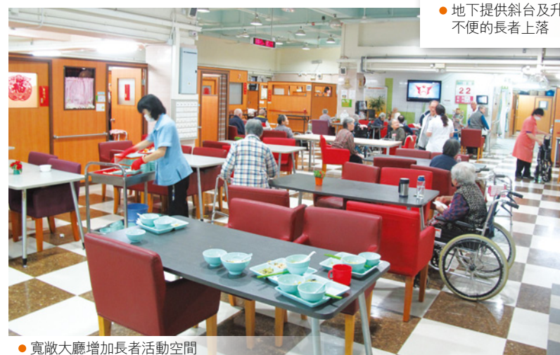
● 寬敞大廳增加長者活動空間