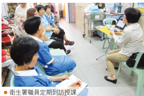
● 衛生署職員定期到訪授課