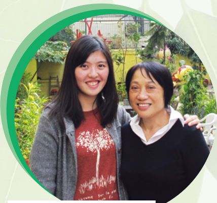
● 香港醫護學會幹事與院長合照