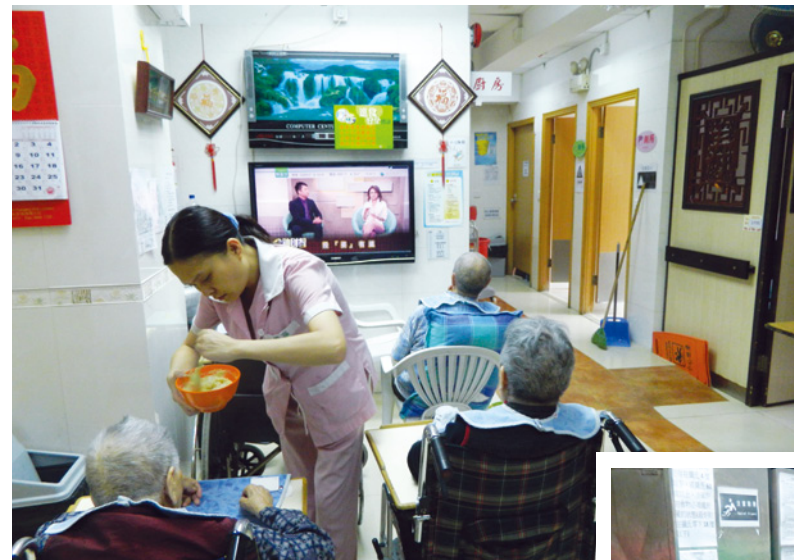
● 員工悉心協助院友進餐

要求，並通過有關的審批。由此可見，「優質計劃」就造三贏局面，既透過嚴謹的評核及監察，推動本港長者服務營運機構致力提升服務的質素及效益，亦為長者帶來更專業及稱心的護理服務，令家人倍感安心。同時亦促進市民大眾對長者服務的認識，讓社會能就計劃選擇適合的院舍予家人。