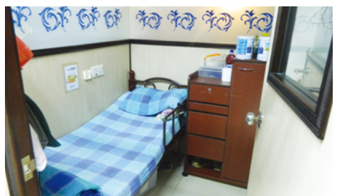
● 院舍更提供單人床位，增加私隱度