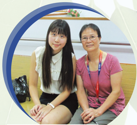
● 香港醫護學會幹事與院長合照