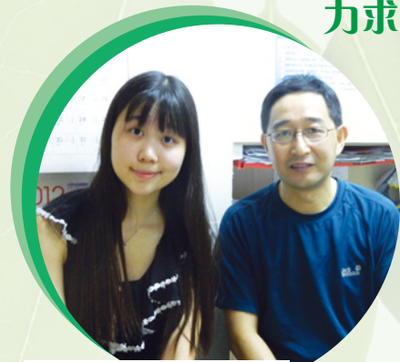
● 香港醫護學會幹事與院長合照