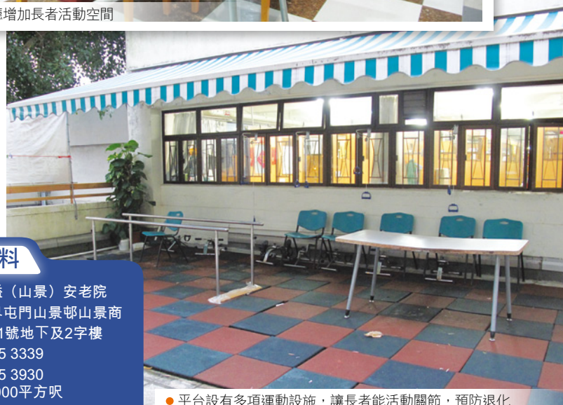
● 平台設有多項運動設施，讓長者能活動關節，預防退化

名稱：鈞溢 (山景) 安老院 地址：新界屯門山景邨山景商場21號地下及2字樓 電話：2455 3339 傳真：2455 3930 面積：17,000平方呎 床位：97張