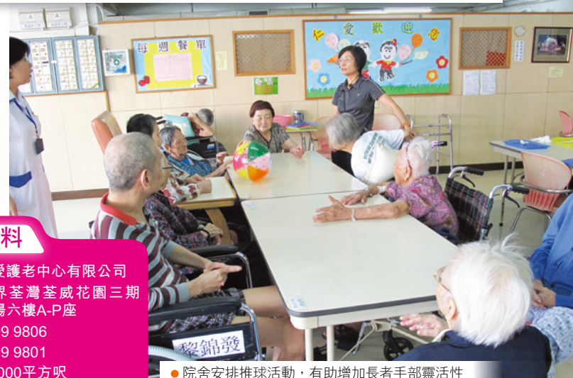
● 院舍安排推球活動，有助增加長者手部靈活性