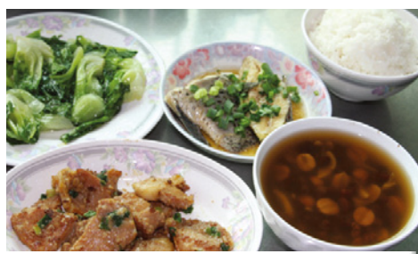
● 每餐三饅一湯，設有糖尿、痛風及耆英保健藥膳餐

穩健護老院位於元朗洪水橋，遠離市區，附近環境清幽，像走出香港般，是鬧市的世外桃源。這樣怡人的環境讓人心曠神怡，煩惱一概拋諸腦後，盡情享受自然。