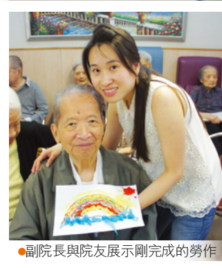
● 副院長與院友展示剛完成的勞作