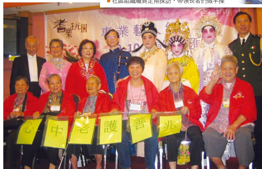
● 院舍為院友安排粵劇欣賞