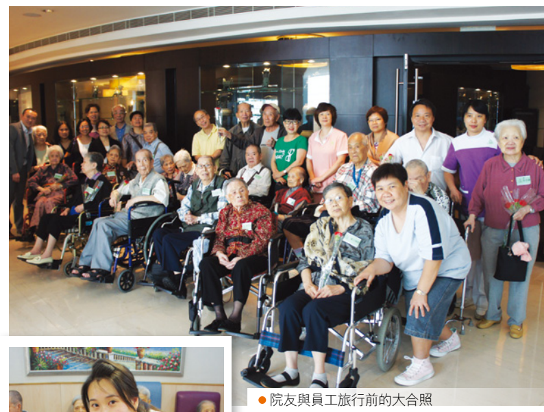
● 院友與員工旅行前的大合照

設備及服務是一所院舍的命脈，所以護老院舍必須時刻保持警覺，自律作出檢查。「優質計劃」在這方面能提供充足的協助，我們的專業人員就設施作出仔細檢查，並即時提供意見，更會確保院舍能達到合資格水平。可見這計劃不但有效提升院舍質素，更為市民大眾在選擇安老院舍時，提供明顯指標。