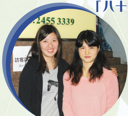
● 香港醫護學會幹事與副主任合照