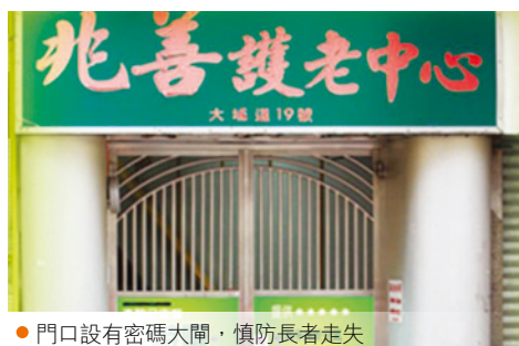
● 門口設有密碼大閘，慎防長者走失