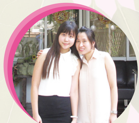
● 香港醫護學會幹事與副院長合照