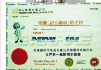
● 煮食使用第一級過濾飲用水，去除所有化學物質、孢囊、雜質及水垢等