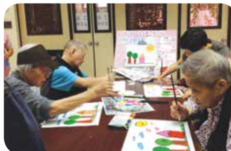
社工安排院友的小組畫畫活動，院友們都很努力完成作品