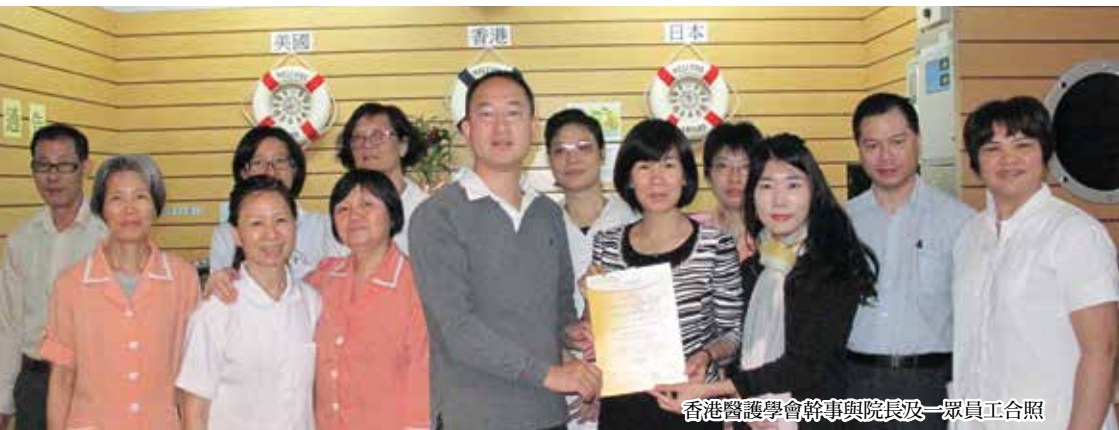
香港醫護學會幹事與院長及一眾員工合照