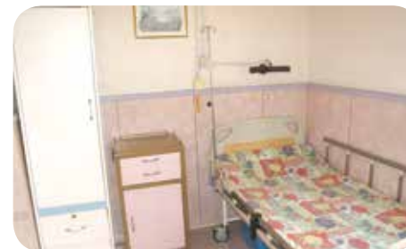
院舍的房間間格整齊，讓長者有足夠的活動空間