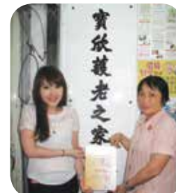
香港醫護學會幹事頒發證書給院長