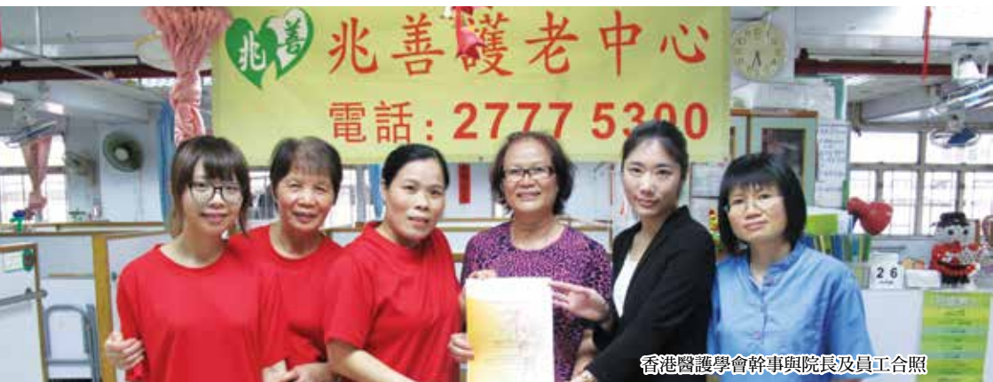
香港醫護學會幹事與院長及員工合照