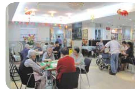
院舍大堂寬敞，提供充足休憩空間