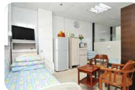
房間設計整齊，空間感足