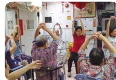
社區組織職員定期探訪，帶領長者做早操