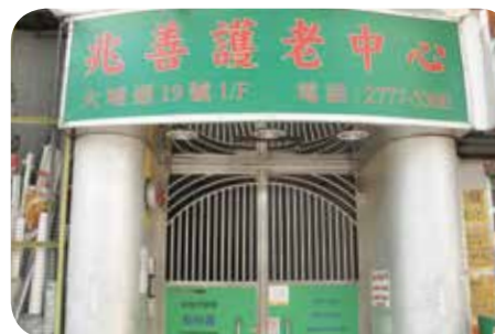
門口設有密碼大閘，慎防長者走失