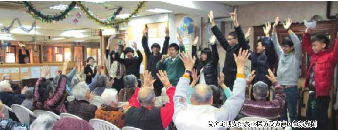
院舍定期安排義工探訪及表演，氣氛熱鬧