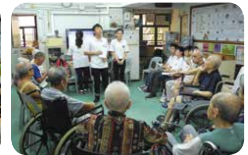
紅十字義工們到院舍探訪