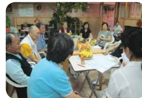
院舍定期與院友、家屬及員工進行會議