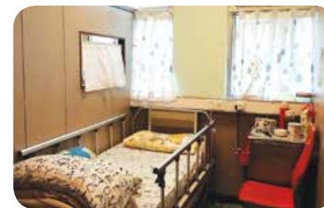
房間設計整齊，空間感足