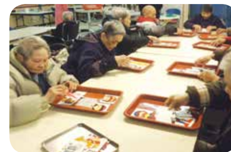
社工安排院友進行不同的活動如拼圖等認知訓練