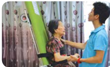
院舍設有物理復康治療服務，讓長者能活動關節，防止關節老化