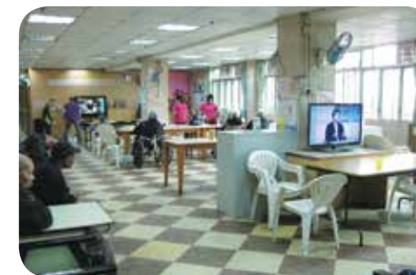
院舍地方寬敞，提供充足休憩空間