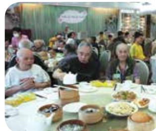
定期帶長者到酒樓聚餐，與眾同樂