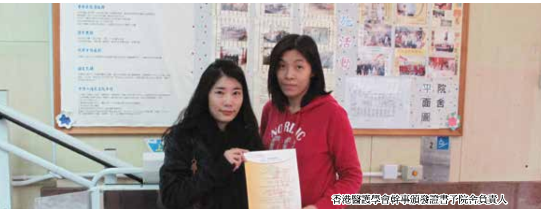
香港醫護學會幹事頒發證書予院舍負責人