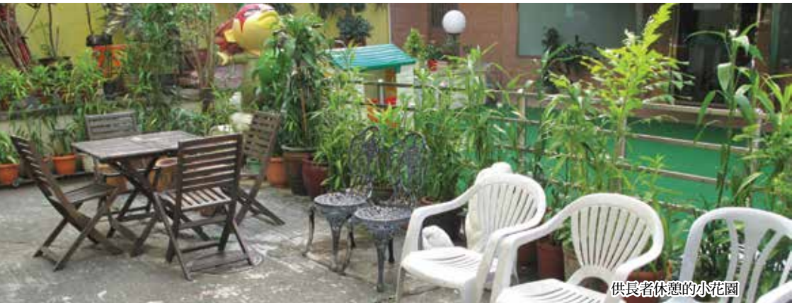
供長者休憩的小花園