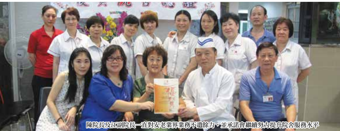
陳院長及江副院長一直對安老業界業務不遺餘力，並承諾會繼續努力提升院舍服務水平