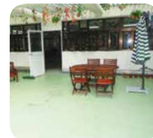
院舍的花園露台環境優美，清潔整齊