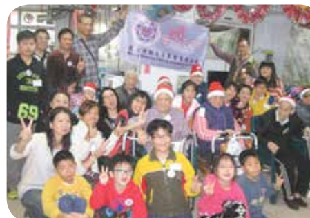
義工們於聖誕時節探訪院友及玩遊戲，長幼同樂