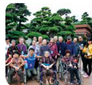
院舍每年度舉辦一次外出旅行