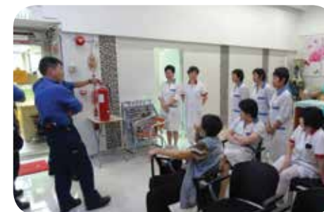
定期檢查消防設備及舉辦消防演習以保障長者安全