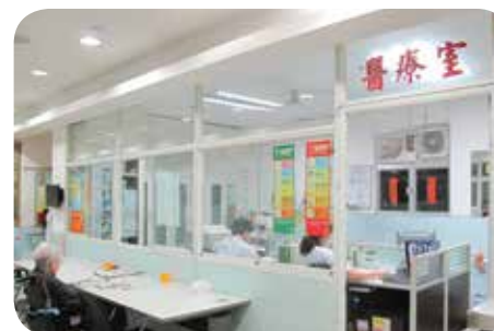
院內設有獨立醫療室