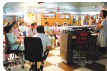
院舍定期替員工進行培訓