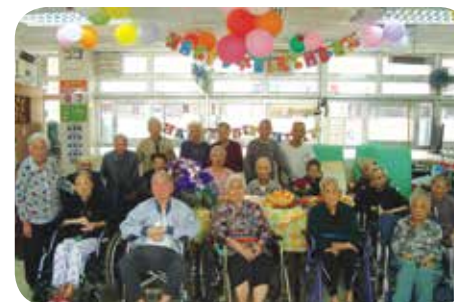
院舍安排生日會為院友們慶生