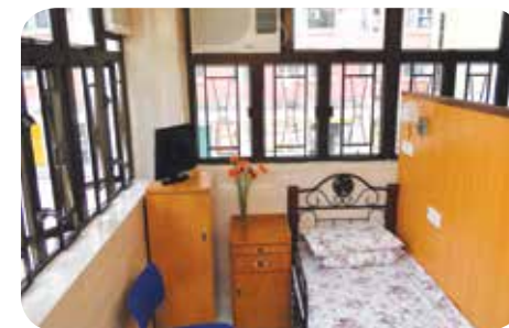
房間設有獨立間格，能保障私隱度