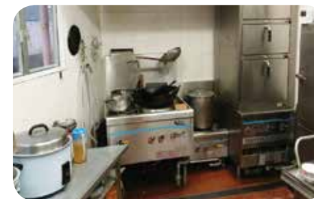
廚房設備清潔整齊，每日提供健康膳食予院友