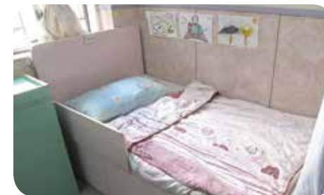
院舍設有多種房間供客人選擇