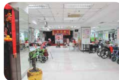
長者活動空間非常寬敞