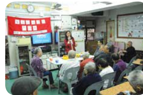
院舍每一季均舉行生日會為長者們慶生