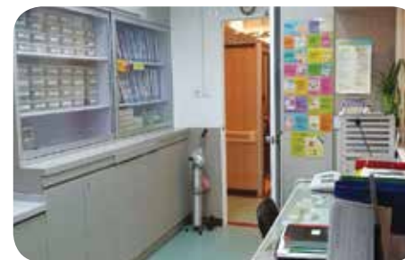
院舍設有護士站，能為長者隨時提供援助