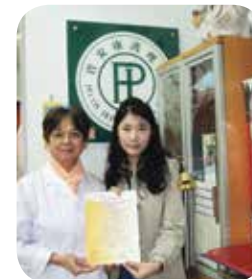
香港醫護學會幹事頒發證書給院長