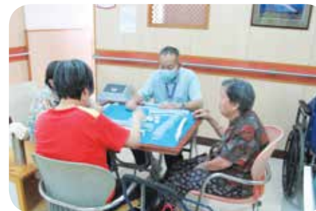
院友於自由時間打麻雀消閒