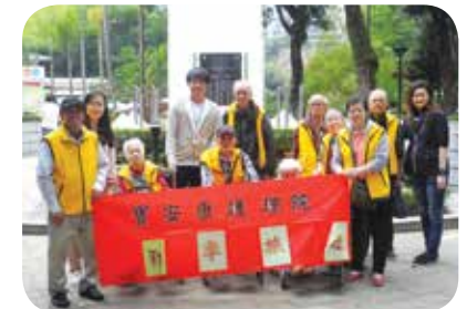
院舍定期舉辦郊遊活動