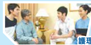
護理及復康治療評估

百本的专业外展工作队，包括注册护士、物理治疗师、职业治疗师、注册社工等，可为客人提供到户临床评估服务，从多方面作出护理及复康治疗需要评估，从而制订合适的护理及康复计划及更適切地跟进康复进度。