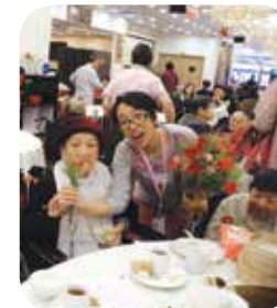
院舍帶領院友於母親節到茶樓飲茶，並送上玫瑰花表心意