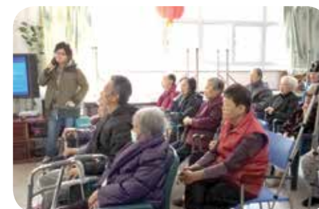
院友在大堂欣賞雜耍表演