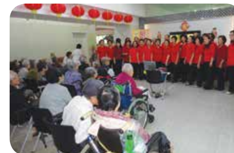
院舍為院友安排粵曲卡拉OK活動