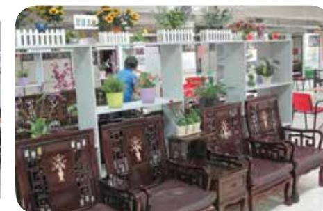
院舍設有獨立閱讀區，多種書籍讓長者培養閱讀的興趣