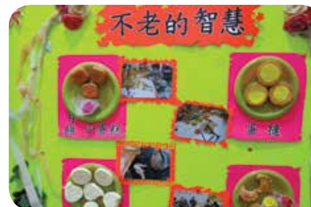
定期為院友舉辦手工藝班等活動，讓院友老有所學