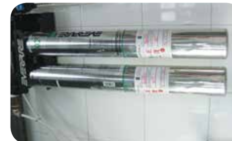
煮食使用第一級過濾飲用水，去除所有化學物質、雜質及水垢等