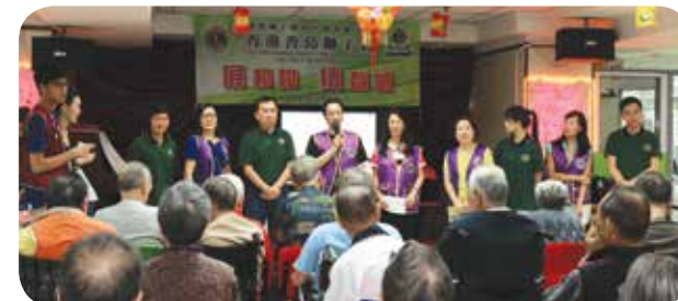
安排義工探訪，與一眾院友唱歌及玩遊戲，歡喜地迎接中秋