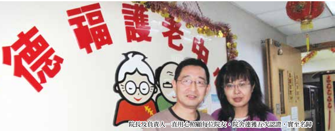
院長及負責人一直用心照顧每位院友，院舍連獲五次認證，實至名歸