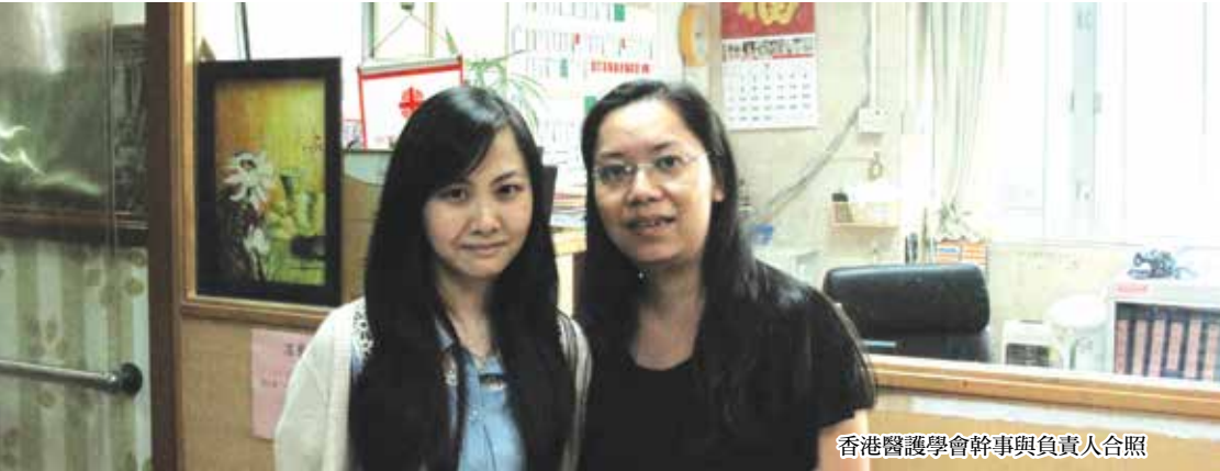
香港醫護學會幹事與負責人合照