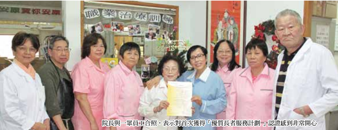
院長與一眾員工合照，表示對首次獲得「優質長者服務計劃」認證感到非常開心

寶安康護理院位於西環，環境清幽，大堂及住宿地方的裝修均充滿住家的感覺。院舍由資深註冊護士主理，以愛心及關懷長者，使長者得到充足的護理及照顧。以下為院舍特色：