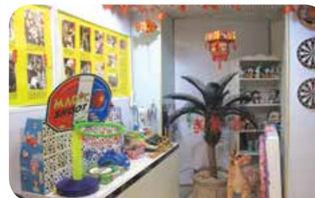
院舍備有多款娛樂設施供長者娛樂