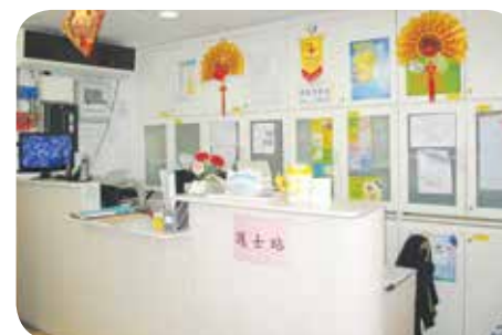
院舍設有護士站，能為長者隨時提供援助