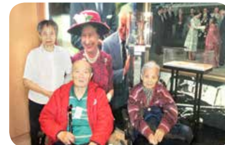
院舍設有活動時間表，定期舉辦院外活動如旅行及飲茶活動等