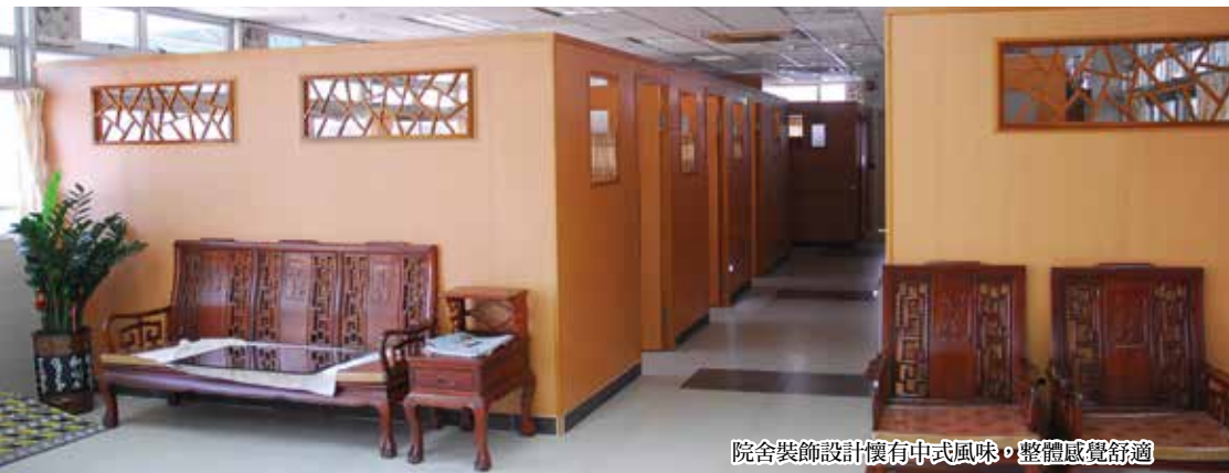
院舍裝飾設計懷有中式風味，整體感覺舒適

麗閣護老院首次參與本計劃，整體符合優質院舍的要求。員工服務態度良好，部份員工擁有急救知識，其他員工亦擁有相關護理證書。以下為院舍特色：