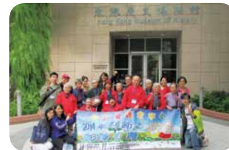
院舍職員帶領院友到香港歷史博物館參觀