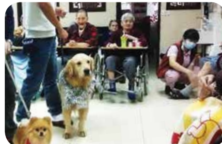
院舍定期安排「狗醫生」義工探訪長者