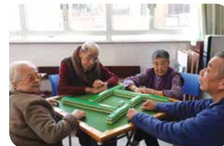
一眾院友在自由活動時間打麻雀消閒