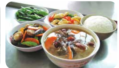
每餐三餸一湯，設有糖尿餐、痛風餐及耆英保健藥膳餐