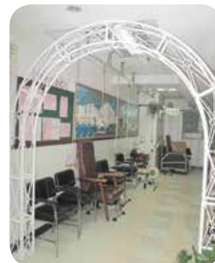
運動室有多種不同設施，供長者們舒展筋骨