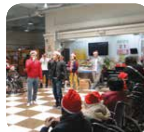
院舍安排義工探訪