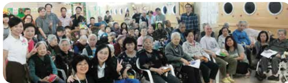
院舍定期與長者家屬會議，增強溝通讓員工更能照顧長者的需求