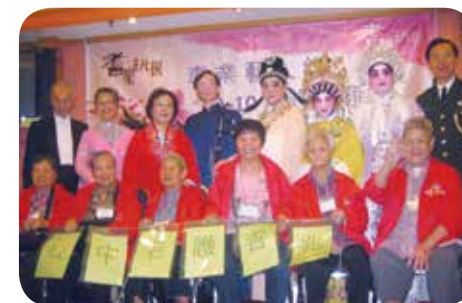
院舍為院友安排粵劇欣賞