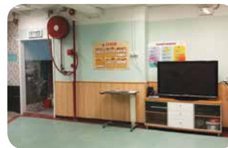
院舍客廳寬敞，讓長者有充足的活動空間