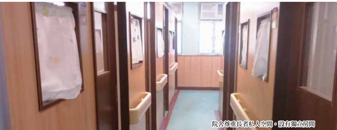
院舍尊重長者私人空間，設有獨立房間