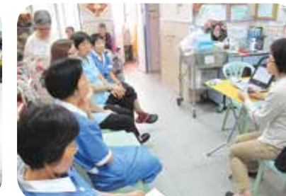
衛生署職員定期到訪院舍向員工授課