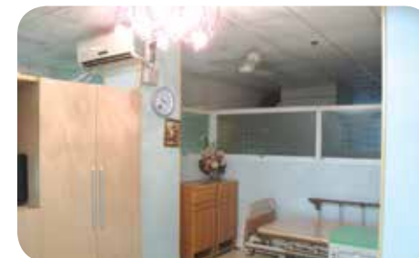
院舍的單人房設計空間感足