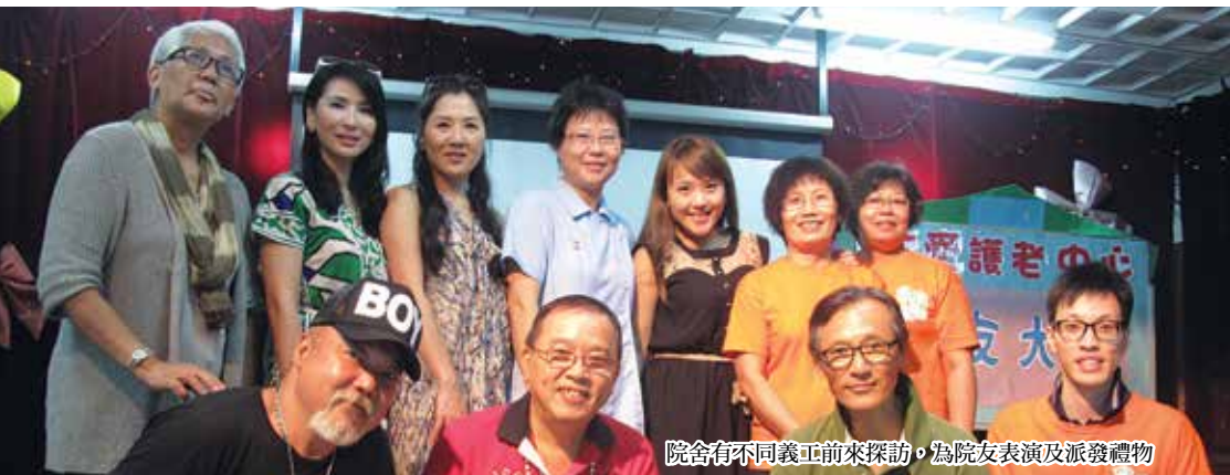
院舍有不同義工前來探訪，為院友表演及派發禮物