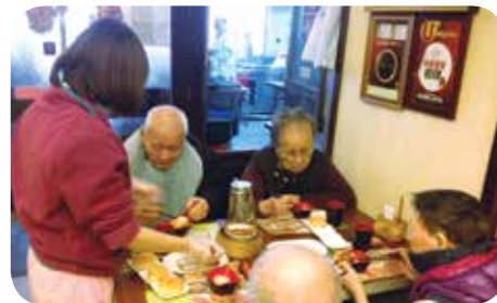
院舍每月三次帶長者到茶樓聚餐