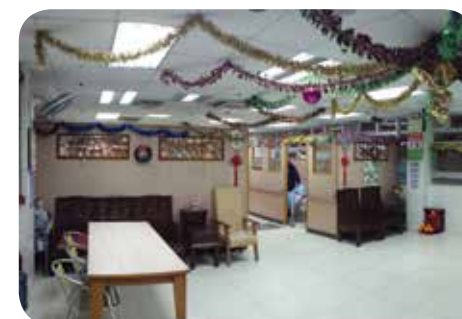
於聖誕節時佈置裝飾，讓院舍充滿聖誕氣氛