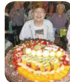
院舍每月舉辦生日會為長者慶生