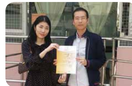
香港醫護學會幹事頒發證書予院舍負責人