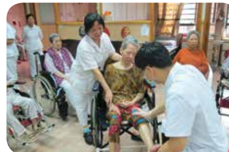
院舍為長者提供物理治療服務及簡單運動設施