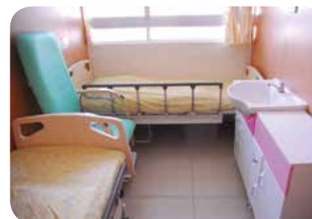
房間設計及傢俬均能保持整潔及排列整齊