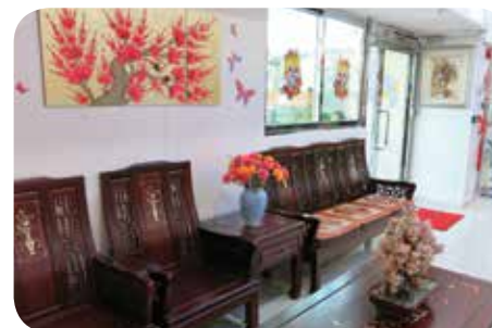
院舍地方寬敞舒適，讓長者有廣闊的空間進行活動