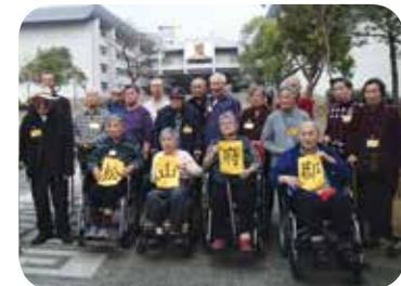
院友與員工旅行的大合照