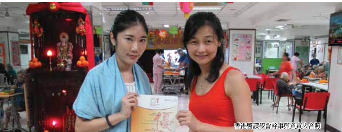
香港醫護學會幹事與負責人合照